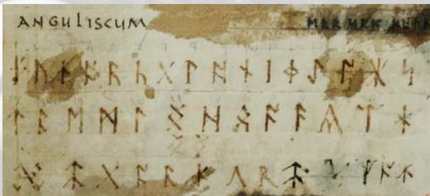
LE FUTHORC ANGLO-SAXON ES REPRESENTATE IN LE DUO LINEAS SUPERIOR DE ISTE MANUSCRIPTO DEL 9E CENTENNIO.

In isto se suspecta le origine del distinction phonemic inter a/e anterior (como in that) e un contraparte a/o posterior (como in what).