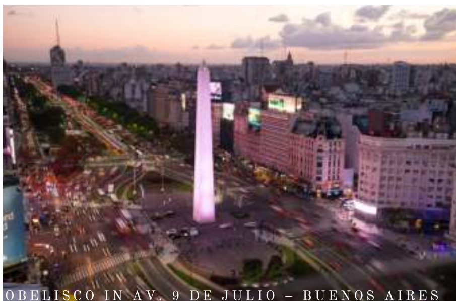
OBELISCO IN AV. 9 DE JULIO – BUENOS AIRES

Le camminos del enorme immigration venezuelan continua a venir per le nord (Amazonia) brasilian al nove Stato Roraima, ma iste nove via occorre per le sud al Stato brasilian le plus sudic Rio Grande do Sul, justo in le fronteira inter Brasil e Argentina.